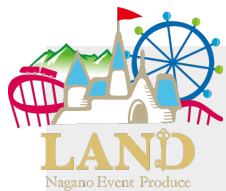
代表 桐山 大地

私たちは、長野県最大級のイベント団体「LAND」と、デザイン・イベント制作オフィス「プルグラデザイン」が共同で設立した、 謎解きイベント専門のプロデュースチーム です。